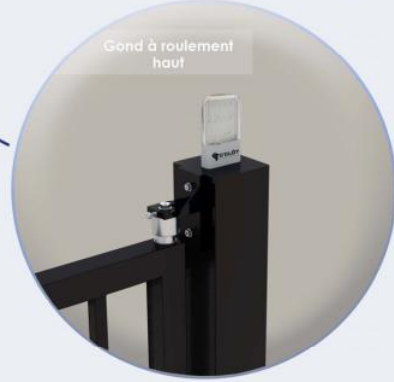
Gond à roulement haut