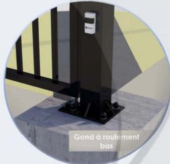
Gond à roulement bas