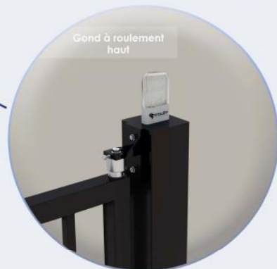
Gond à roulement haut