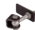
Gonds réf : GBMU-Z-M16