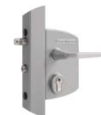
Serrure réf : LAKQ U2