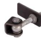
Gonds réf : GBMU-Z-M16