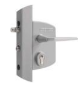
Serrure réf : LAKQ U2