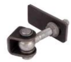
Gonds réf : GBMU-Z-M16

Mentions légales : Les fiches techniques sont éditées par : SAS C'CLÔT - RCS de LYON 491 237 046 Propriété intellectuelle : Les textes et illustrations ne peuvent être modifiés, reproduits ou distribués sans autorisation de l'éditeur sous peine de sanctions pénales prévues aux articles L. 335.2 et L. 343.1 du code de la Propriété Intellectuelle.