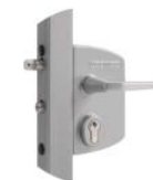
Serrure réf : LAKQ U2