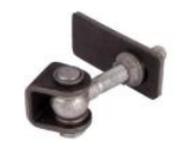
Gonds réf : GBMU-Z-M16

Mentions légales : Les fiches techniques sont éditées par : SAS C'CLÔT - RCS de LYON 491 237 046 Propriété intellectuelle : Les textes et illustrations ne peuvent être modifiés, reproduits ou distribués sans autorisation de l'éditeur sous peine de sanctions pénales prévues aux articles L. 335.2 et L. 343.1 du code de la Propriété Intellectuelle.