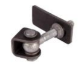
Gonds réf : GBMU-Z-M16

Mentions légales : Les fiches techniques sont éditées par : SAS C'CLÔT - RCS de LYON 491 237 046 Propriété intellectuelle : Les textes et illustrations ne peuvent être modifiés, reproduits ou distribués sans autorisation de l'éditeur sous peine de sanctions pénales prévues aux articles L. 335.2 et L. 343.1 du code de la Propriété Intellectuelle.