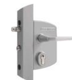
Semure réf : LAKQ U2