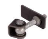
Gonds réf : GBMU-Z-M16

Mentions légales : Les fiches techniques sont éditées par : SAS C'CLÔT - RCS de LYON 491 237 046 Propriété intellectuelle : Les textes et illustrations ne peuvent être modifiés, reproduits ou distribués sans autorisation de l'éditeur sous peine de sanctions pénales prévues aux articles L. 335.2 et L. 343.1 du code de la Propriété Intellectuelle.