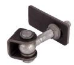
Gonds réf : GBMU-Z-M16

Mentions légales : Les fiches techniques sont éditées par : SAS C'CLÔT - RCS de LYON 491 237 046 Propriété intellectuelle : Les textes et illustrations ne peuvent être modifiés, reproduits ou distribués sans autorisation de l'éditeur sous peine de sanctions pénales prévues aux articles L. 335.2 et L. 343.1 du code de la Propriété Intellectuelle.