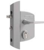
Semure réf : LAKQ U2