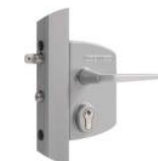
Semure réf : LAKQ U2