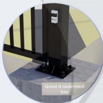
Gond à roulement bas