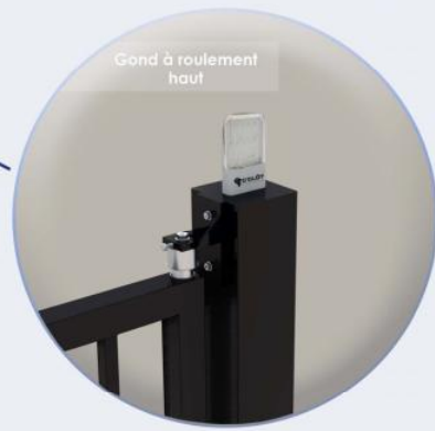
Gond à roulement haut