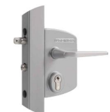
Serrure réf : LAKQ U2