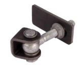
Gonds réf : GBMU-Z-M16

Mentions légales : Les fiches techniques sont éditées par : SAS C'CLÔT - RCS de LYON 491 237 046 Propriété intellectuelle : Les textes et illustrations ne peuvent être modifiés, reproduits ou distribués sans autorisation de l'éditeur sous peine de sanctions pénales prévues aux articles L. 335.2 et L. 343.1 du code de la Propriété Intellectuelle.