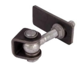
Gonds réf : GBMU-Z-M16

Mentions légales : Les fiches techniques sont éditées par : SAS C'CLÔT - RCS de LYON 491 237 046 Propriété intellectuelle : Les textes et illustrations ne peuvent être modifiés, reproduits ou distribués sans autorisation de l'éditeur sous peine de sanctions pénales prévues aux articles L. 335.2 et L. 343.1 du code de la Propriété Intellectuelle.