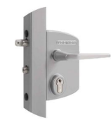
Serrure réf : LAKQ U2