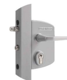
Serrure réf : LAKQ U2