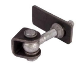
Gonds réf : GBMU-Z-M16

Mentions légales : Les fiches techniques sont éditées par : SAS C'CLÔT - RCS de LYON 491 237 046 Propriété intellectuelle : Les textes et illustrations ne peuvent être modifiés, reproduits ou distribués sans autorisation de l'éditeur sous peine de sanctions pénales prévues aux articles L. 335.2 et L. 343.1 du code de la Propriété Intellectuelle.