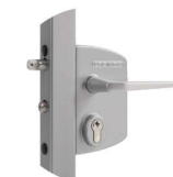
Semure réf : LAKQ U2